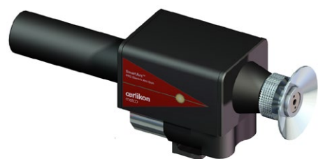
SmartArc PPG 电弧喷枪

SmartArc 全自动运行，采用坚固、可靠的 PLC（可编程逻辑控制）计算机技术，功能特别先进，可提供方便操作者解读的诊断测试。