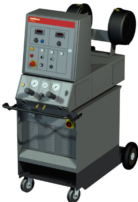
SmartArc PPC 控制台和 350RU 电源（显示选配的电源手推车）

与欧瑞康美科的广泛优质丝材配合使用时，SmartArc 可轻松获得高沉积效率的优异涂层。