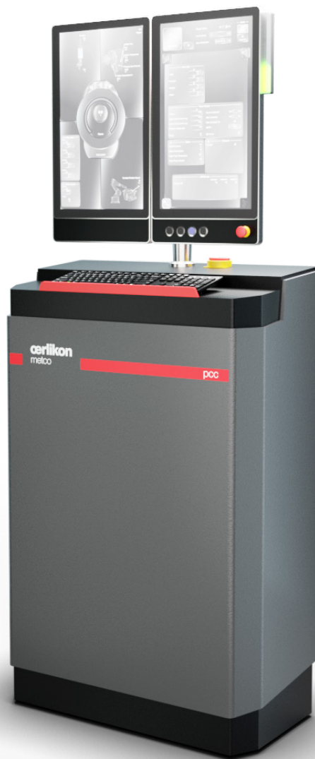
溶射用 MultiCoat5 CPS コントローラ

標準装備として、高機能で直観的なトレンド・レポートパッケージが搭載されています。これはパラメータ監視やパラメータ開発および品質管理に大いに役立ちます。このほか、MultiCoat 5 CPS には、多言語ユーザーインターフェース、溶射パラメータ記憶機能、応答性の高いプロセスガス用デジタル式マスフローコントローラなどを標準搭載しています。