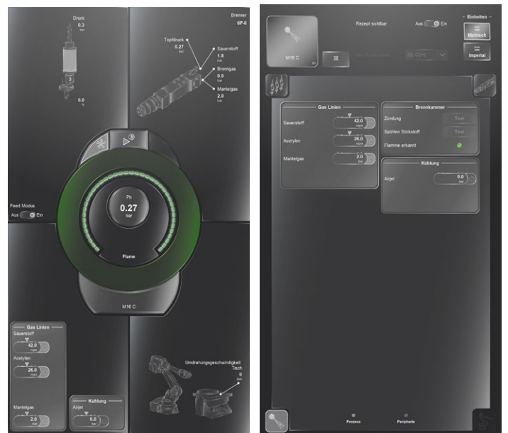
MultiCoat5 CPS – タッチスクリーン操作