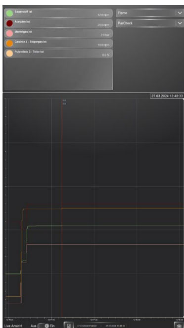
トレンドデータを画面に表示