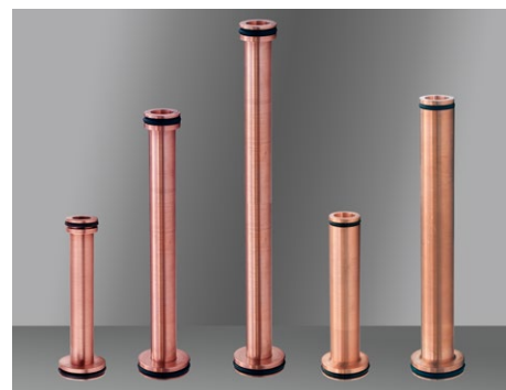
有库存，可快速供货