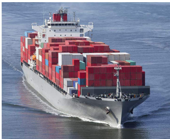
我们的腐蚀涂层非常适合用于海洋环境

欧瑞康美科使用涂层解决方案和设备进行表面强化。客户得益于种类极其丰富的表面技术、涂层解决方案、设备、材料、服务以及专业加工服务和部件，创新解决方案改善性能并提高效率 and 可靠性。欧瑞康美科服务的行业包括发电、航空航天、汽车以及其他专业市场。