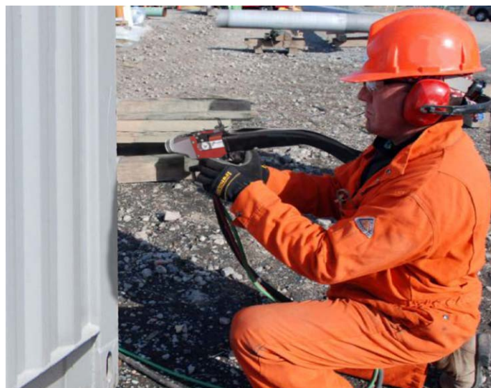
使用锌-铝涂层对集装箱进行涂覆

我们的抗腐蚀涂层是大部分油漆和有机罩面漆保护层应用的出色基体层，可在热喷涂涂层之后立即涂覆油漆和罩面漆。与热浸镀锌不同，热喷涂不会留下“油腻的”表面。