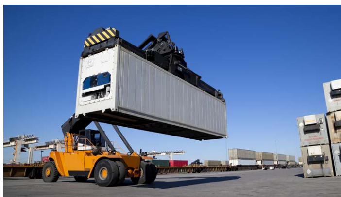
装卸作业引起的损坏加快集装箱腐蚀