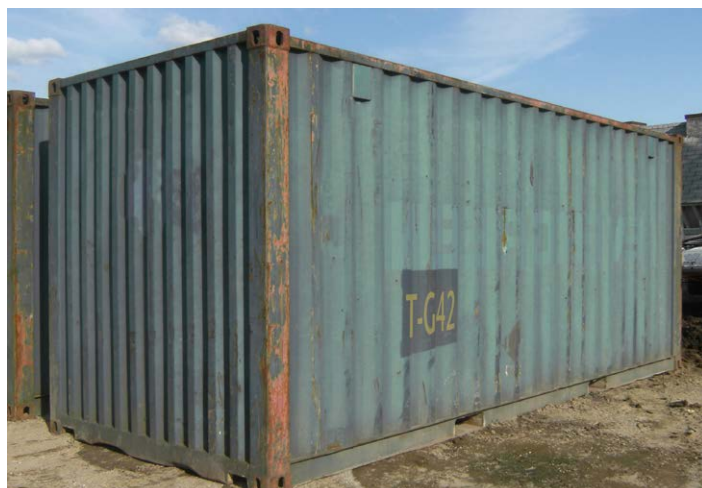
天气和暴露引起的腐蚀