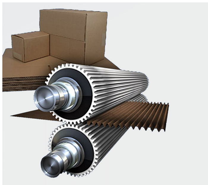
WOKA 精细碳化物是瓦楞辊的理想选择